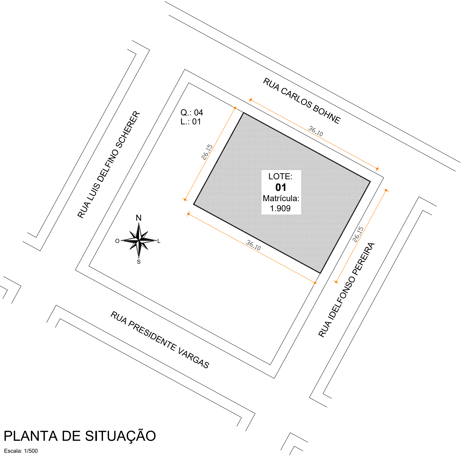
PLANTA DE SITUAÇÃO